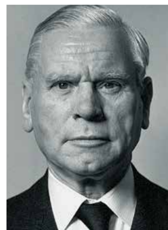
Max Brauer (1887 – 1973)