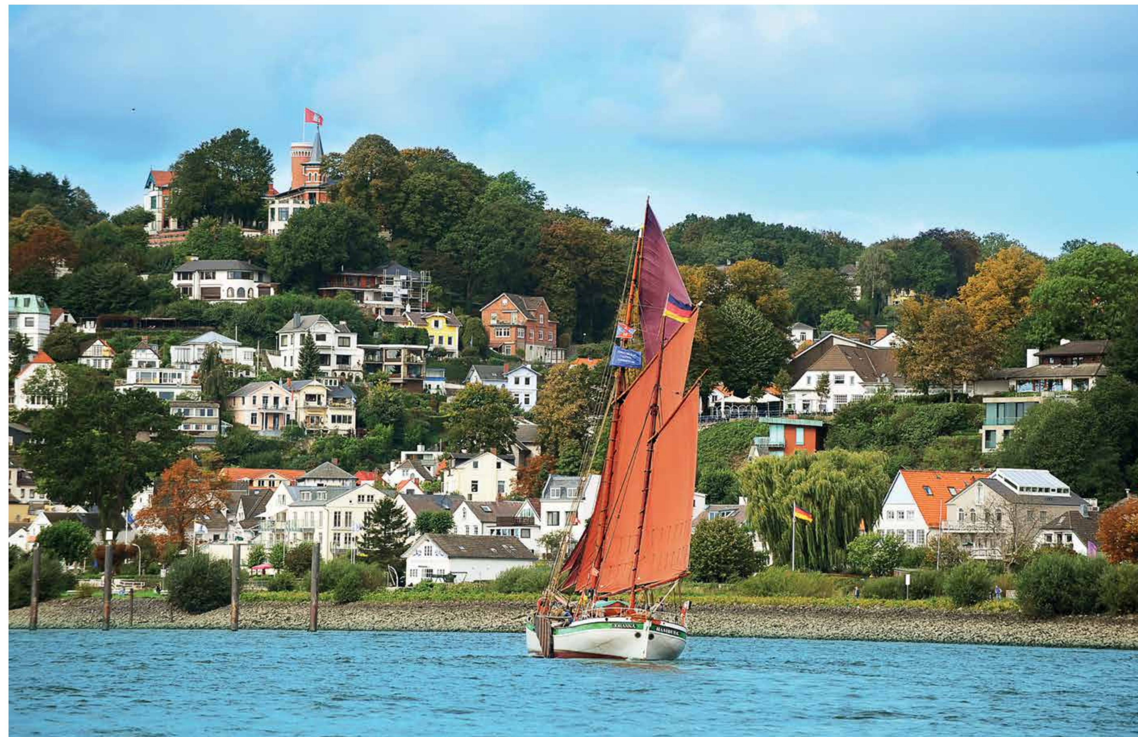
Der Sillberg in Blankenese

Brauer und Oelsner verfolgten ihr Konzept nach dem Zweiten Weltkrieg ab 1948 weiter, nunmehr in ihrer Funktion für ganz Hamburg. Insbesondere das Projekt eines Elbhöhenwegs vom Bismarckstein durch den Römischen Garten in den Falkenstein konnte nunmehr realisiert werden.