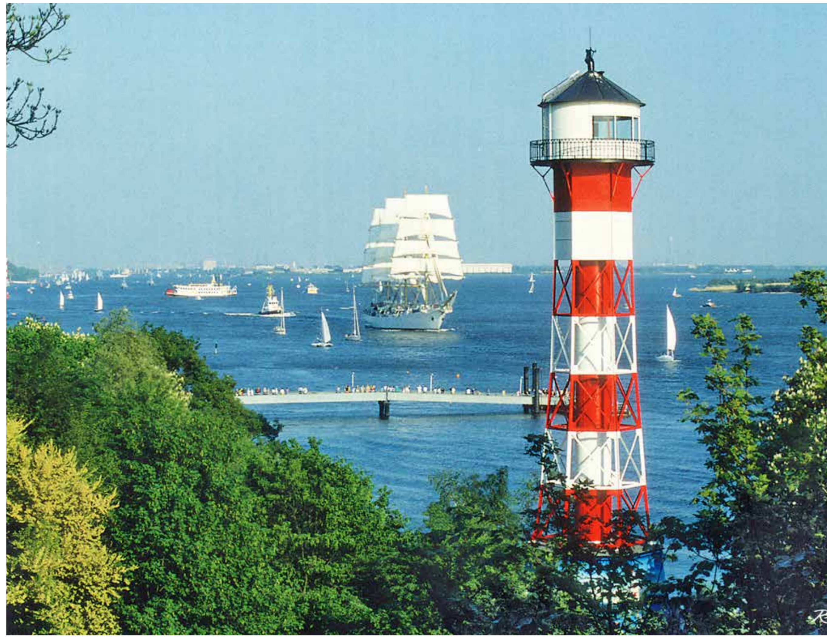
Leuchtturm „Unterfeuer Wittenbergen“